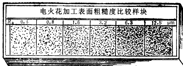
图2 电铸工艺复制的样块